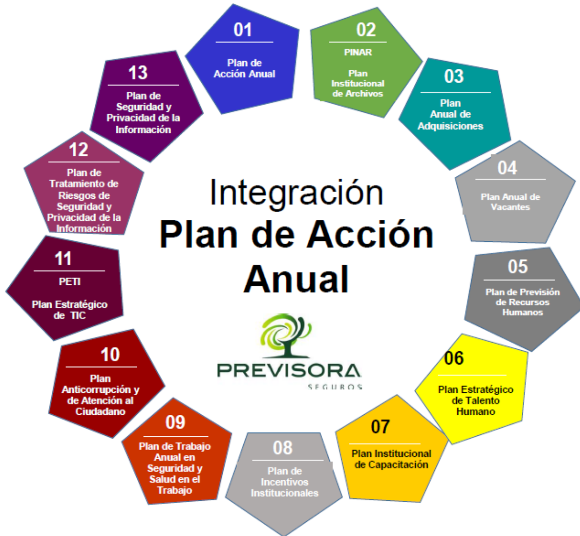
Ilustración 3. Planes integrados al MIPG en La Compañía